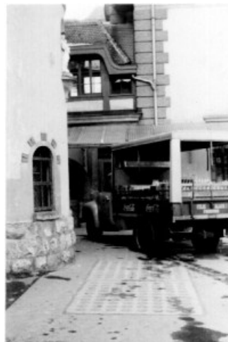
Rue de Botzet...

It is the thin thread, that connects and reconnects friends and some families who would never have enjoyed the knowledge and experience they now share. (Some of those families live in the same towns and didn't know it. Their children go to school together. They shop in the same grocery stores.) It is the "Bingo" that chimes in a sense of belonging as another alumnus is returned to us and the bond is reestablished. And sadly, it lets us know when one has passed. It is naturally international and that is who we are.