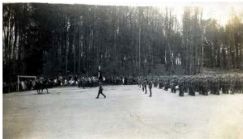
Villa saint jean 1947

Remarque : pour se protéger de virus informatiques, il se peut que les programmes de messagerie électronique évitent d'envoyer ou de recevoir certains types de pièces jointes. Vérifiez les paramètres de sécurité de votre messagerie électronique pour déterminer de quelle manière les pièces jointes sont gérées.