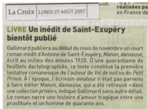
St Ex Manon danseuse

Ecrivain et aviateur, Saint-Exupéry (1900-1944) a publié son premier roman, “Courrier Sud”, en 1928. “Le petit prince”, paru en 1943, s’est vendu depuis à plus de 80 millions d’exemplaires dans le monde.